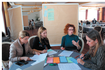
Specifični Trening za trenere iz BiH, Albanije i Crne Gore